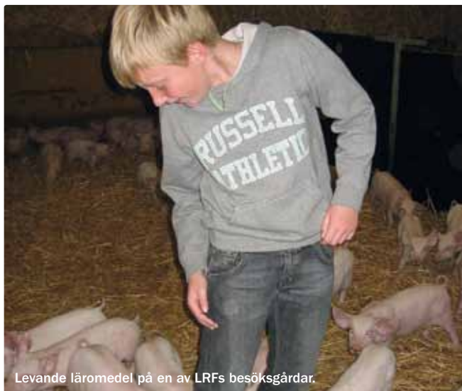
Levande läromedel på en av LRFs besöksgårdar.

LRFs Barn- och ungdomskommunikation bygger värden för Sveriges bönder hos morgondagens beslutsfattare och konsumenter. Och visar på jobbmöjligheterna i de gröna näringarna. LRF tar fram studiematerial för lärare och elever på olika stadier och varje år ordnas gårdsbesök och andra aktiviteter om jord och skog.