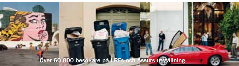
Över 60 000 besökare på LRFs och Assurs utställning.

LRFs frågor om klimatet och maten debatterades flitigt i media under våren och sommaren 2010, då LRF lanserade bildprojektet Hunger tillsammans med fotografen Jens Assur. Hunger bestod bland annat av fem fotoböcker och en stor utställning på Kulturhuset i Stockholm. Syftet var att väcka debatt och bidra till att de stora och livsavgörande frågorna hamnar högst upp på dagordningen hos politiker och beslutsfattare.