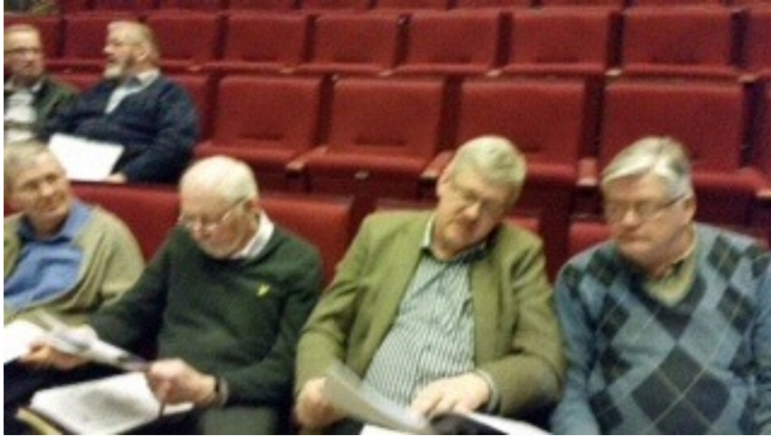
Stämman i Vara