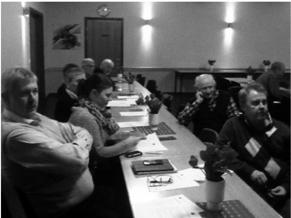
Årsmöte 28 januari 2016