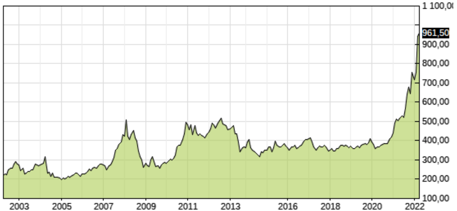
Matif, Rapeseed May '22 (EUR) den 5 april