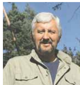
”Vi har kommit till vägs ände” sa LRFs dåvarande ordförande Bo Dockered i slutet av 1980-talet. Trycket på att något måste göras hade blivit för starkt och en strategi lades fast på en extra riksförbundsstämma 1989, det så kallade ”spårbytet”.