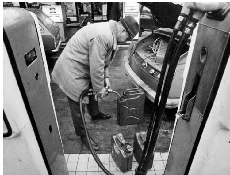
Bensinhamstring 1973. Den här synen var vanlig på våra bensinstationer under oljekrisen. Här fyller en kund sina reservdunkar.

CAPs syfte är att höja effektiviteten, trygga en skälig levnadsnivå för jordbrukarna, stabilisera marknaderna, säkra tillgången på livsmedel och garantera livsmedel till skäliga priser. Dessa mål skiljer sig inte nämnvärt från de syften som låg bakom den svenska jordbrukspolitiken efter andra världskriget.