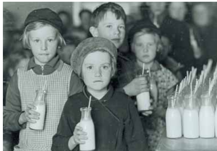
Lantbrukets första PR-sammanslutning: föreningen Mjolkpropaganda som startades 1923. Den kallades även för Mjolkpropagandan och var de svenska mejeriernas lobbyorganisation. Man gav ut tidskrifter och ordnade mjölkdagar i svenska skolor.

Världsläget påverkade förstås även de svenska bönderna. Jordbruket var i Sverige en central sektor. På 30-talet sysselsatte jordbruket i vid mening fortfarande omkring en tredjedel av arbetskraften. Prisfallet kulminerade 1932/33. Svårigheterna att exportera blev också värre av att flera länder, Sverige inkluderat, höjde tullarna för att skydda sina jordbruk. De svenska bönderna landade i att mer eller mindre strunta i exporten och